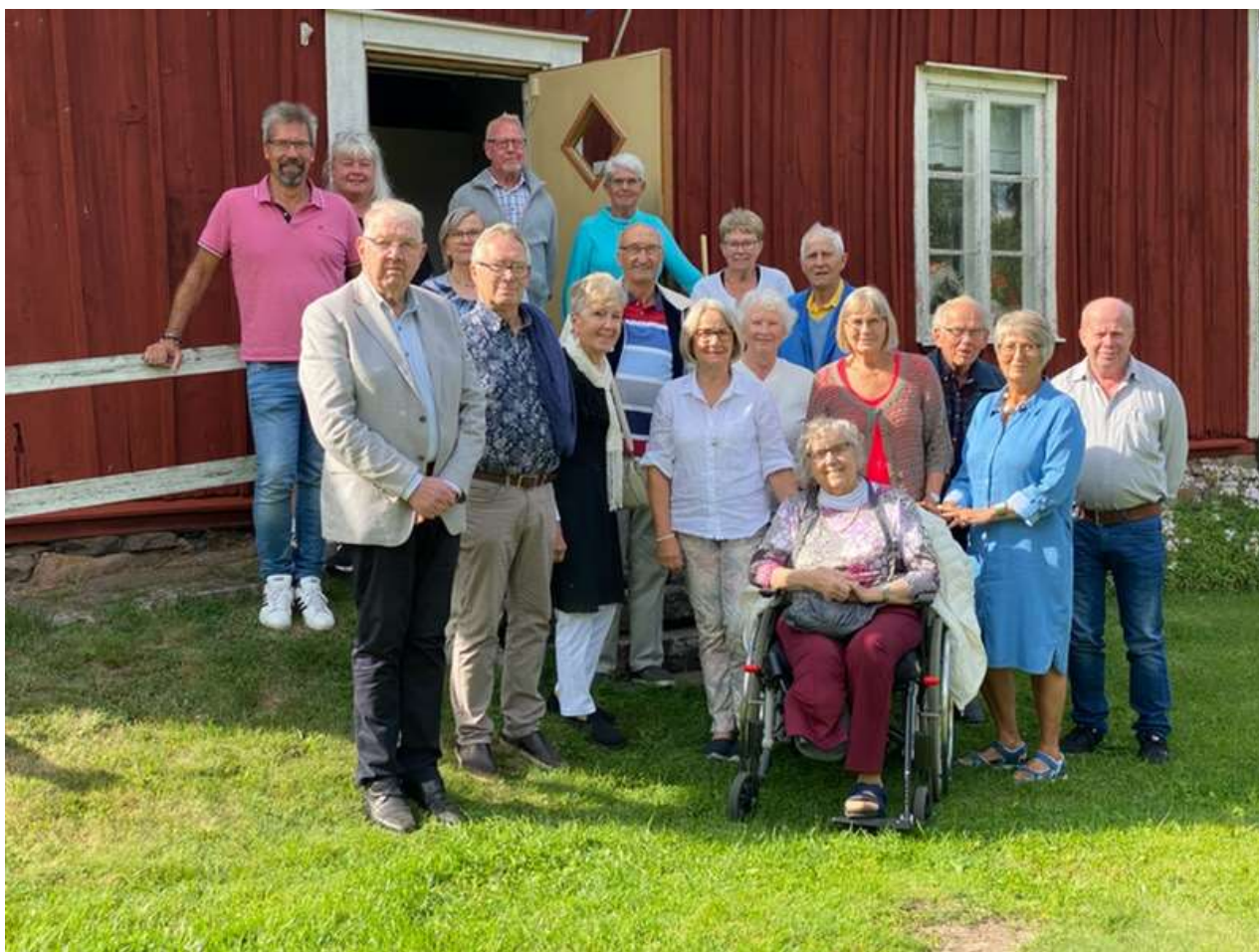
Styrelsen med respektive vid styrelsemötet i Kronogården, Trädet i början av augusti 2021.

Vi kommer att skicka julhälsningen digitalt till de E - postadresser vi har för att spara in lite på kostnaderna. Vi är således hela tiden i behov av att öka på vårt register av E-postadressen. Skicka ett mejl till urban.azelius@telia.com