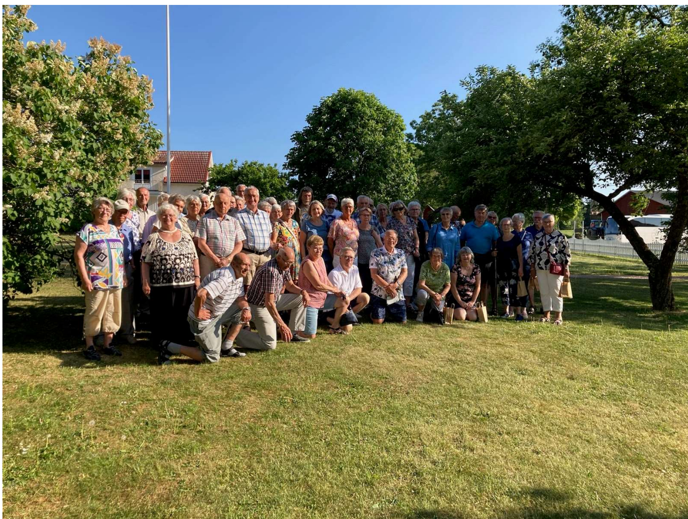
Deltagare i Tunbergs sommarresa 2023.