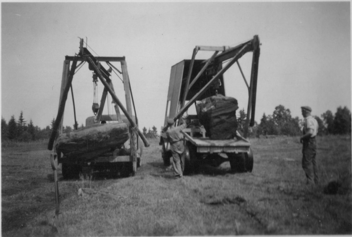
Stenupptaging. Se Margareta Thors text.