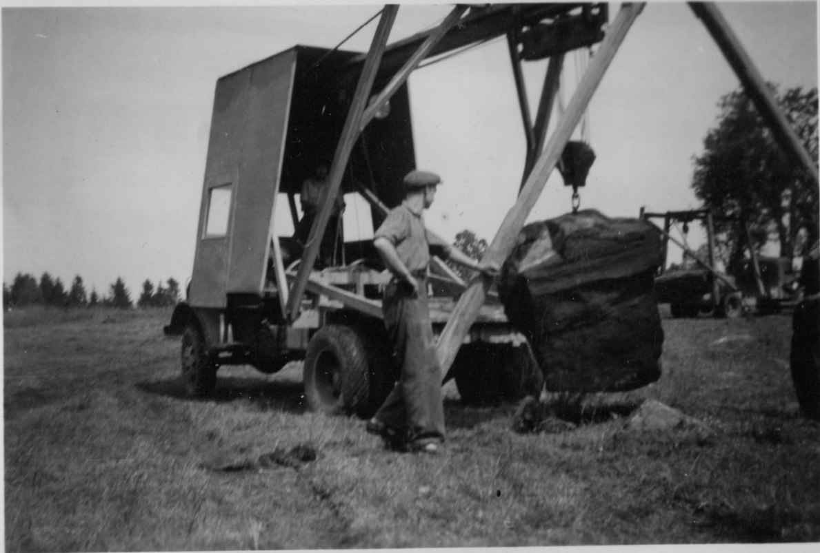
Stenupptagning på Granet i Kinneved 1953