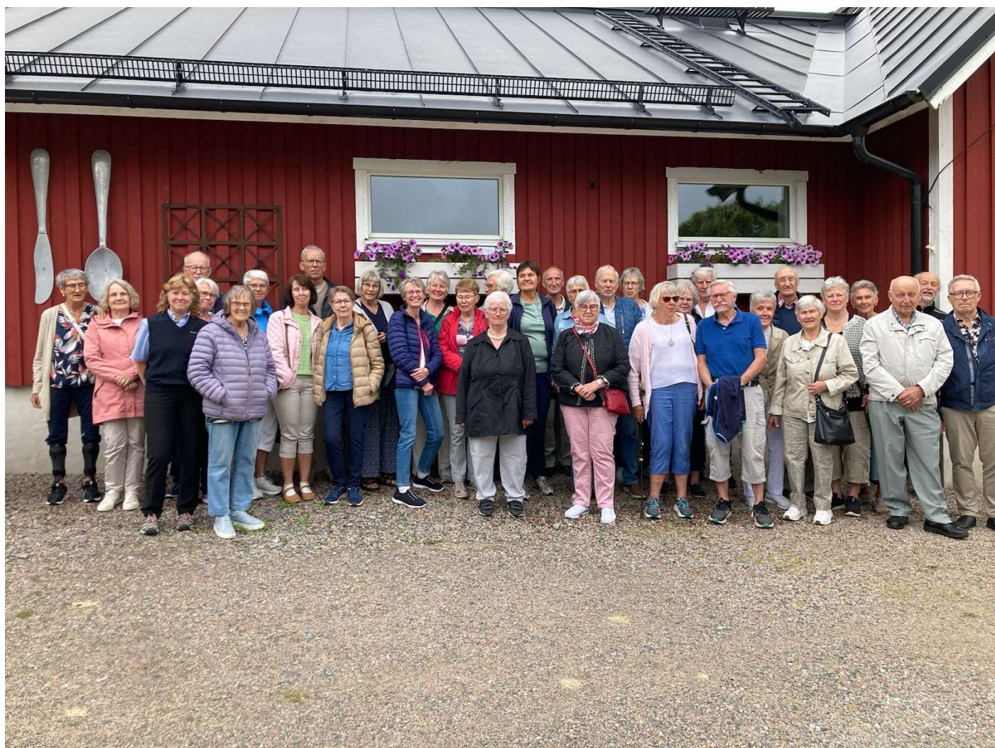
Deltagarna i Tunbergs sommarresa 2024.

Adressen är falbygden.nu - lättare adress finns inte. Skriv bara in adressen i sökfältet så är saken klar. Hemsidan är aktiv men lider svårt av brist på intressant material för löpande uppdatering. Jag efterlyser medhjälpare som vill hjälpa till med att skaffa material. Om hemsidan skall leva måste många hjälpa till //Åke